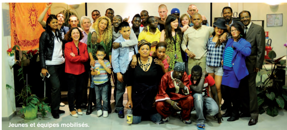
Jeunes et équipes mobilisés.

→ Ces courts-métrages sont en ligne sur le site de l'URFJT Ile-de-France : www.fjt-idf.fr , rubrique photos et films. À découvrir et à partager !